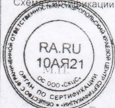
Схема сертификации: 3/3с

Руководитель органа (заместитель руководителя) Эксперт