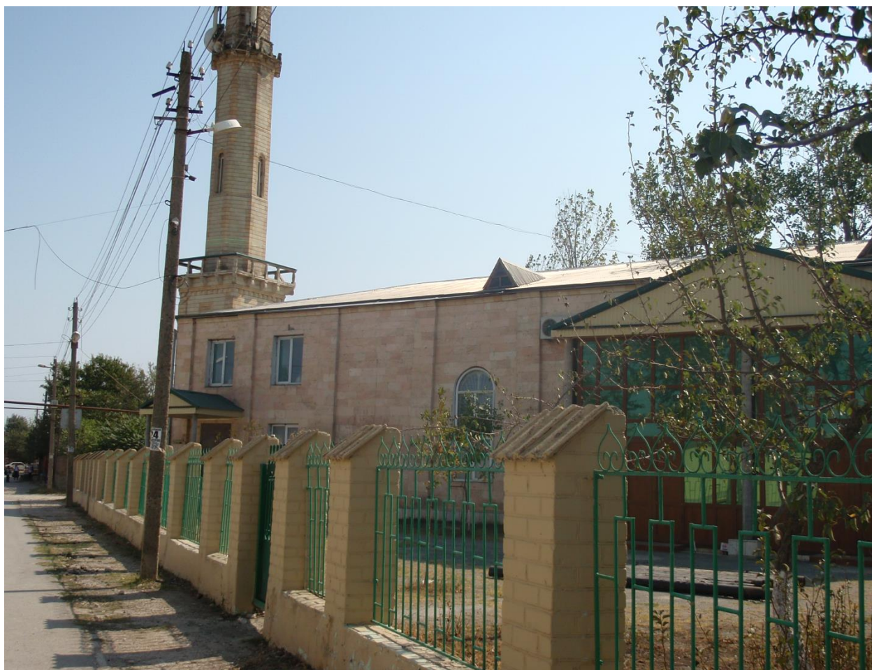
Аксай центральная Джума Мечеть